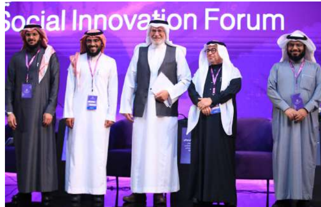
معالي د. علي النملة ي رأس إحدى جلسات المنتدى