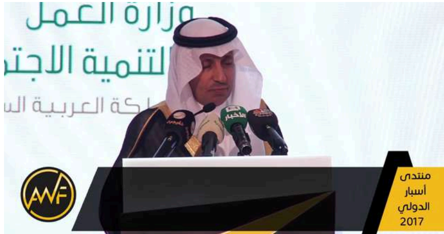
وزير العمل والتنمية الاجتماعية السابق معالي الأستاذ علي بن ناصر الغفيص يلقي كلمته في فعاليات منتدى أسبار الدولي