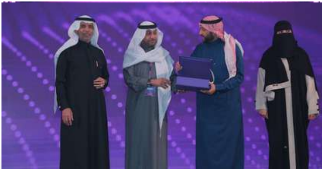
جانب من تسليم الجوائز للفائزين

أطلق أسبار أيضاً جائزة سنديان للابتكار الاجتماعي ، عام 2022، تحقيقاً لأهداف «منتدى الابتكار الاجتماعي» في تعزيز الابتكارات والأفكار المميزة، التي تقدّم حلولاً فعّالة لتحسين حياة المجتمع، وتسعى الجائزة إلى تحفيز الابتكار الاجتماعي، وتكريم المبادرات الاجتماعية ورؤاد الأعمال الاجتماعيين، وتحفيز القطاعات الثلاثة (الحكومي والخاص، وغير الربحي) للمساهمة والإبداع في العمل الاجتماعي، بما يعزز مستهدفات رؤية المملكة 2030 في دعم الابتكار. وهي أول جائزة في مجالها على مستوى المملكة والوطن العربي. وتضع الجائزة من ضمن أهدافها التوسّع لتشمل الوطن العربي ثم على مستوى العالم.