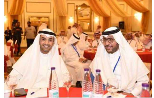
الأمين العام لدول مجلس التعاون الخليج العربية معالي الدكتور نايف فلاح مبارك الحجره متحدثاً في فعالية ضيف ملتقى أسبار