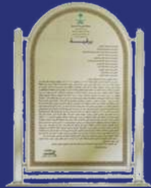
تعميم المقام السامي

تهدف هذه الدراسة إلى التعرّف على سعر النفط من فوهة البئر حتى وصوله إلى المستهلك النهائي، وبالتالي تحديد أسباب ارتفاع أسعار المنتجات النفطية لدى المستهلك النهائي، إذ اتضح أن ذلك إنّما يعود إلى ارتفاع الضرائب على الوقود في الدول المعنية نفسها. وناقشت الدراسة الاقتصاد السياسي لضرائب النفط لمعرفة أسبابها ومبرراتها. وكانت هذه الدراسة إحدى أوراق العمل في المؤتمر الدولي للطاقة الذي عُقد في الرياض في العام 2005.