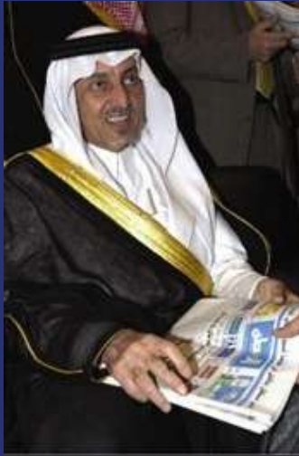
الأمير خالد الفيصل ي دشّن العدد الأول