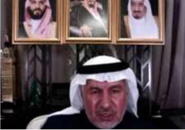
معالي الدكتور عبدالله الربيعه متحدثاً في فعالية ضيف ملتقى أسبار