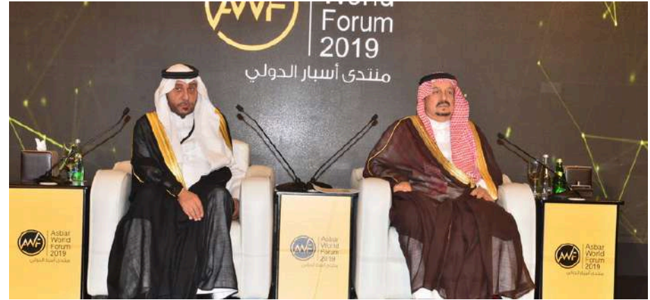
صاحب السمو الملكي الأمير فيصل بن بندر بن عبدالعزيز، أمير منطقة الرياض في افتتاح فعاليات منتدى أسبار الدولي