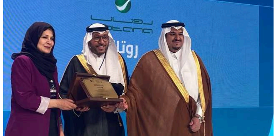
صاحب السمو الملكي الأمير محمد بن عبدالرحمن بن عبدالعزيز نائب أمير منطقة الرياض في فعاليات منتدى أسبار الدولي