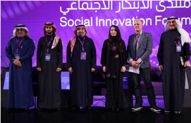
معالي د. عبدالعزيز الخضير ي رأس إحدى جلسات المنتدى

انطلقت دورته الثانية بعنوان "جيل الإلهام" في عام 2023 بمدينة الرياض تحت رعاية كريمة من الأمير فيصل بن بندر بن عبدالعزيز، أمير منطقة الرياض. تضمنت هذه الدورة أكثر من 40 جلسة وفعالية مرافقة، وأكثر من 30 محاضرة وورشة عمل، شارك فيها أكثر من 200 متحدث من خبراء ومختصين في مجال الابتكار الاجتماعي وريادة الأعمال الاجتماعية من أكثر من 15 دولة حول العالم.