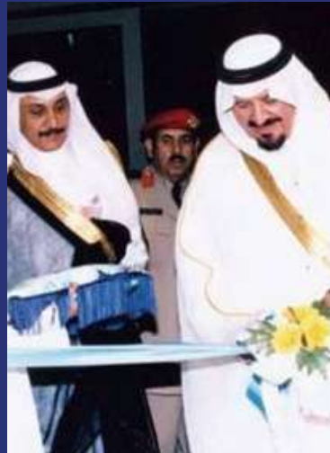
الأمير سلطان -رحمه الله- يفتتح مبنى المؤسسة