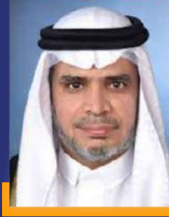
معالي د. أحمد العيسى وزير التعليم

“أشكر زملائي في منتدى أسبار الدولي في مركز أسبار على دعوتي للحضور والمشاركة في هذا اللقاء وأنا سعيد بالمشاركة مع هذه الكوكبة من زملائي المختصين والمهتمين بميدان المعرفة والذي لهم جهود كبيرة في هذا المجال