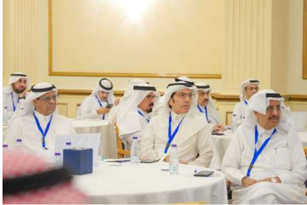
جانب من أعضاء ملتقى أسبار في الحفل السنوي للملتقى