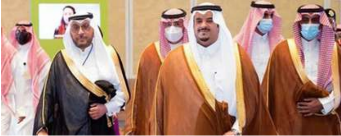
صاحب السمو الملكي الأمير محمد بن عبدالرحمن بن عبدالعزيز نائب أمير منطقة الرياض في إحدى مناسبات أسبار