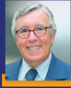
معالي د. محمد بن عيسى وزير الشؤون الخارجية والتعاون - المغرب

"أود أن أهني كل العاملين وكل الذين شاركوا في تنظيم هذا المنتدى وخاصة الشباب والشابات"