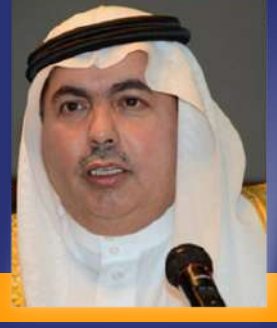
الأمير د. تركي بن سعود آل سعود رئيس مدينة الملك عبد العزيز للعلوم والتقنية

ويأتي انعقاد منتدى أسبار الدولي في دورته الثالثة، بعنوان (عصر المستقبل السعودية غدا) لبحث بعض عناصر وأهداف الرؤية للوصول إلى تلك الأهداف الطموحة، لقد جاءت المحاور الرئيسية التي حددها المنتدى في هذه الدورة منسجمة مع غايته وأهدافه.