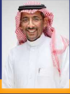
معالي أ. بندر بن إبراهيم الخريف وزير الصناعة

“يشرفني اليوم أن كون معكم في منتدى أسبار لهذا العام هذا المنتدى الذي اختار هذا المسمى المميز “مستقبل المستقبل ونحن بالفعل في مملكتنا الغالية ومع رؤية المملكة 2030 بالفعل نرسم “مستقبل المستقبل“. وعندما ننظر إلى رؤية المملكة ومحتواها بشكل عام فهي تؤسس كيف تكون المملكة العربية السعودية كيف تحقق مستقبلا مزدهرا بإذن الله تعالى.