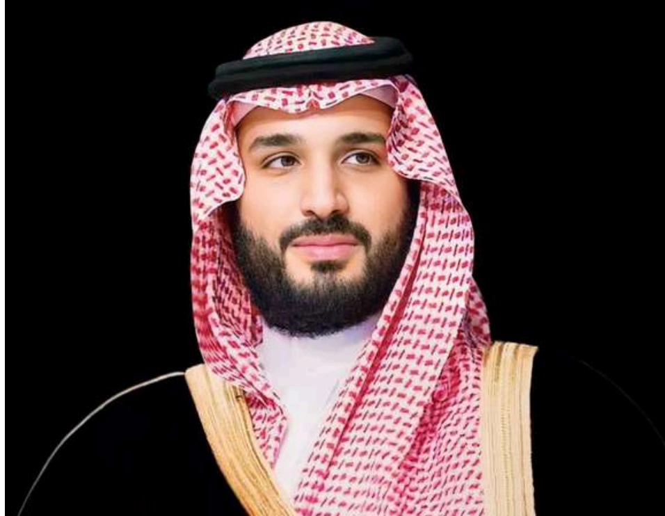
صاحب السمو الملكي الأمير محمد بن سلمان بن عبد العزيز آل سعود ولي العهد ورئيس مجلس الوزراء

“اعتمدنا تطلُّعات طموحة لقطاع البحث والتطوير والابتكار، لتصبح المملكة من رواد الابتكار في العالم، وسيصل الإنفاق السنوي على القطاع إلى 2.5 % من إجمالي الناتج المحلي في عام 2040”