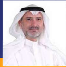
معالي د. نبيل كوشك الرئيس التنفيذي وعضو مجلس إدارة "الشركة السعودية للاستثمار الجرىء"

سنركز في منتدى أسبار هذا العام، على الحراك في مجال الاستثمار الجريء في المملكة العربية السعودية، عدد وحجم الاستثمارات في هذا القطاع العالي المخاطرة، هذا العام هو أكبر من الأعوام السابقة، ونتوقع له النمو في السنوات القادمة وذلك بسبب إطلاق المملكة العديد من المبادرات لتحفيز الاستثمار في هذا القطاع.