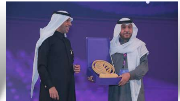
لحظة انطلاق فعاليات جائزة سنديان للابتكار الاجتماعي