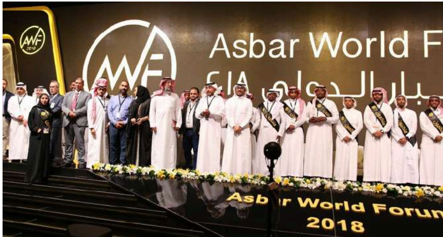
جانب من الحضور في فعاليات منتدى أسبار الدولي