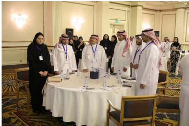
جانب من الحضور في الحفل السنوي للملتقى أسبار