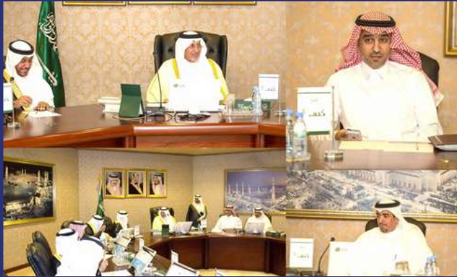
الأمير خالد الفيصل مع فريق العمل على دراسة الاحتياجات التنموية