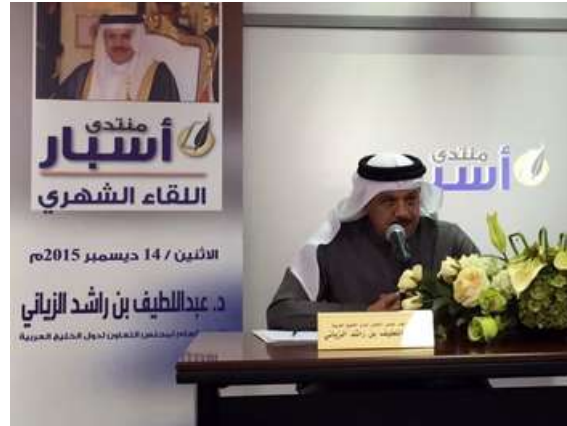
الأمين العام لدول مجلس التعاون الخليج العربية معالي الدكتور عبدالله الزياتي متحدثاً في فعالية ضيف ملتقى أسبار