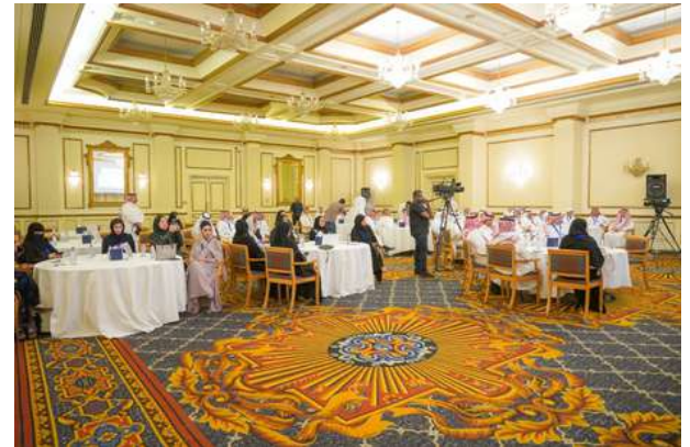
جانب من الحضور في الحفل السنوي للملتقى أسبار