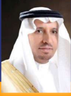
معالي د. علي الغفيص وزير العمل والتنمية الاجتماعية

"أشكر الإخوة القائمين على هذا المنتدى وعلى هذا التنظيم المتميز وعلى اللقاء الذي يمثل لنا جميعاً فرصة لتبادل الخبرات والمعرفة والعمل على تعزيزها وتنميتها. كما أشكر الإخوة في مركز أسبار للدراسات والبحوث والمشاركين في المنتدى على جهودهم