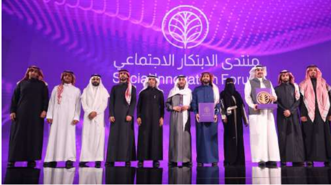
الفائزون بجائزة سنديان (الدورة الثانية)

أطلق أسبار أيضاً جائزة سنديان للابتكار الاجتماعي ، عام 2022، تحقيقاً لأهداف «منتدى الابتكار الاجتماعي» في تعزيز الابتكارات والأفكار المميزة، التي تقدّم حلولاً فعّالة لتحسين حياة المجتمع، وتسعى الجائزة إلى تحفيز الابتكار الاجتماعي، وتكريم المبادرات الاجتماعية ورؤاد الأعمال الاجتماعيين، وتحفيز القطاعات الثلاثة (الحكومي والخاص، وغير الربحي) للمساهمة والإبداع في العمل الاجتماعي، بما يعزز مستهدفات رؤية المملكة 2030 في دعم الابتكار. وهي أول جائزة في مجالها على مستوى المملكة والوطن العربي. وتضع الجائزة من ضمن أهدافها التوسّع لتشمل الوطن العربي ثم على مستوى العالم.