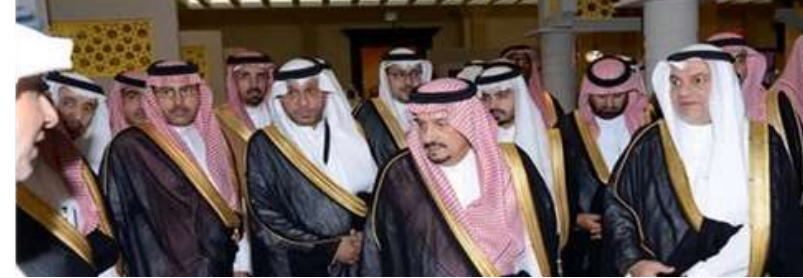
صاحب السمو الملكي الأمير فيصل بن بندر بن عبدالعزيز آل سعود - أمير منطقة الرياض يري مناسبات أسبار