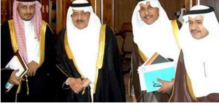
صاحب السمو الملكي - رحمه الله- الأمير نايف بن عبدالعزيز يستعرض دراسة " الشباب السعودي: المشكلات والطموح والتطلعات