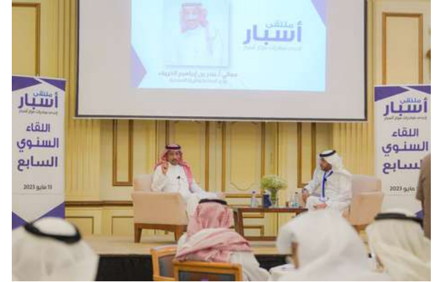
وزير الصناعة والثروة المعدنية معالي الأستاذ بندر بن إبراهيم الخريف في الحفل السنوي للملتقى أسبار