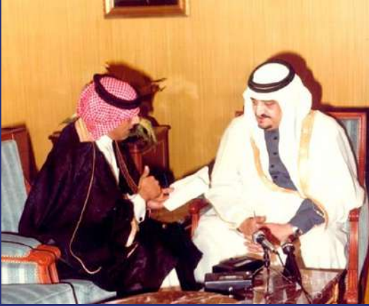
الملك فهد - رحمه الله