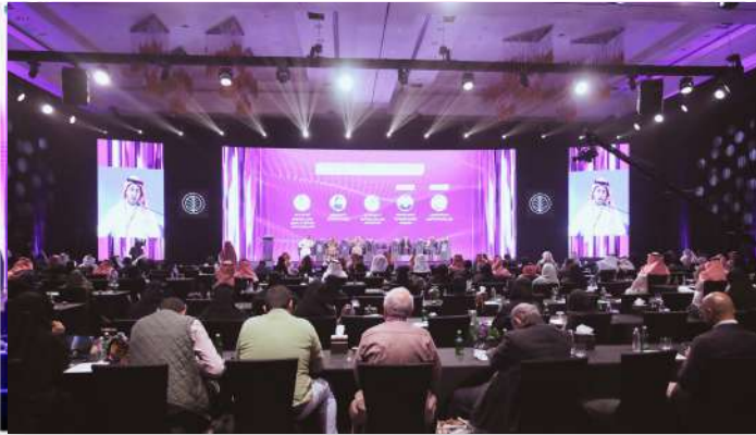
جانب من حضور المنتدى

أطلق أسبار مؤخراً (عام 2022) منتدى الابتكار الاجتماعي ويُعنى بالكشف عن المبادرات والمشروعات والمؤسسات التي تقدم الحلول المبتكرة للتحديات المجتمعية في حقول مختلفة مثل: الصحة والتعليم والبيئة ودعم الأسر الأقل دخلاً .. الخ... وعقد عدد من الشراكات المهمة في هذا المجال مع جامعات ومنظمات محلية ودولية، كما استطاع أن يحقق نجاحاً ملحوظاً على مستوى الشراكات المحلية مع الهيئات والجمعيات والمؤسسات ذات العلاقة في القطاع غير الربحي ، وهو ينوي الاستمرار في تنمية هذه العلاقات وتعزيزها . والابتكار نشاط واعد بلا شك .