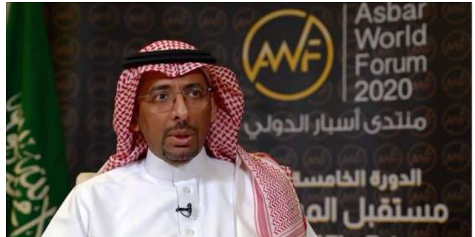
وزير الصناعة والثروة المعدنية معالي الأستاذ بندر بن إبراهيم الخريف أثناء حديثه في فعاليات منتدى أسبار الدولي