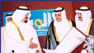
أ. قينان الغامدي رئيس تحرير صحيفة الوطن أثناء افتتاح المؤسسة