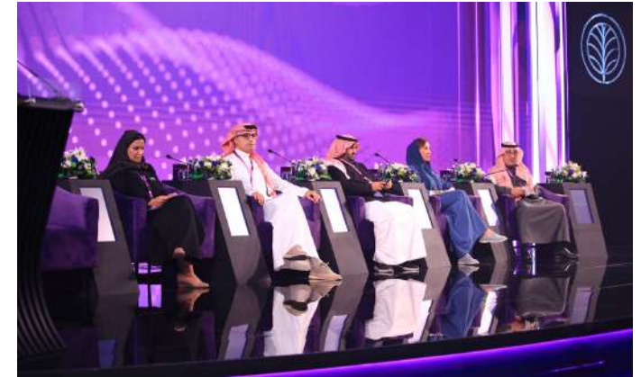
معالي الأستاذ تركي الشبانه ي رأس إحدى جلسات المنتدى