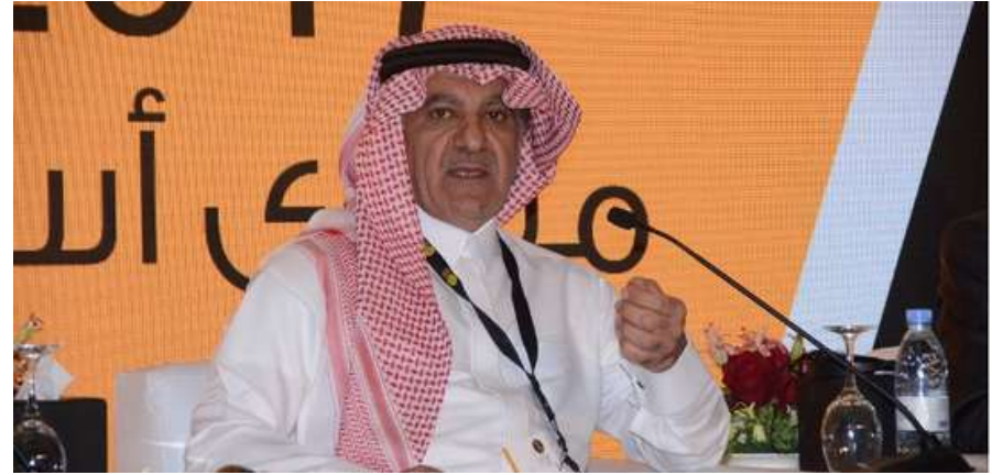
وزير الإعلام السعودي الأسبق معالي الأستاذ تركي بن عبد الله الشبانة أثناء حديثه في فعاليات منتدى أسبار الدولي