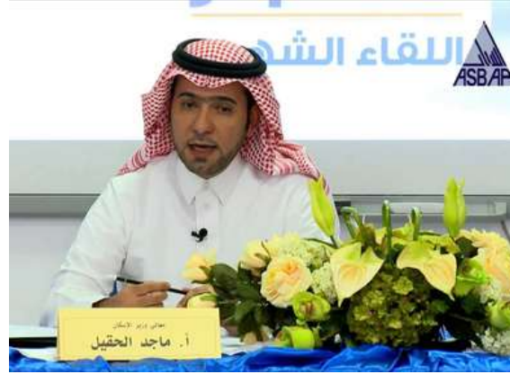
معالي وزير الإسكان الأستاذ ماجد الحقييل متحدثاً في فعالية ضيف ملتقى أسبار