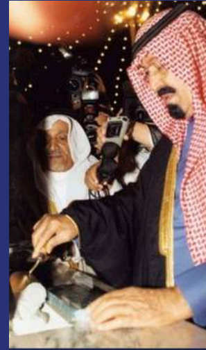
الملك عبدالله - رحمه الله - يضع حجر الأساس