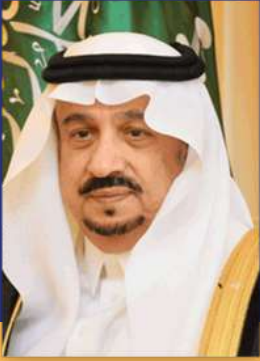
صاحب السمو الملكي الأمير فيصل بن بندر بن عبدالعزيز