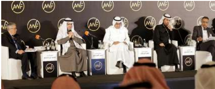
مجموعة من أصحاب المعالي الوزراء في إحدى جلسات النقاش في أسبار