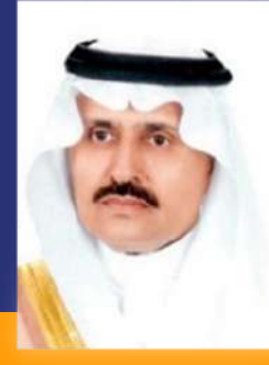
معالي د. محمد أبو ساق وزير الدولة عضو مجلس الوزراء