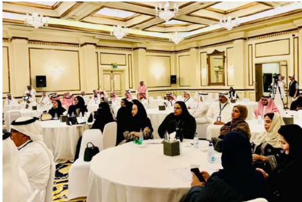
جانب من الحضور في الحفل السنوي للملتقى أسبار