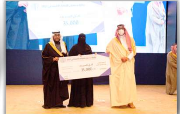
صاحب السمو الملكي الامير سعود بن خالد بن فيصل بن عبدالعزيز نائب أمير منطقة المدينة المنورة، في فعاليات منتدى الابتكار الاجتماعي