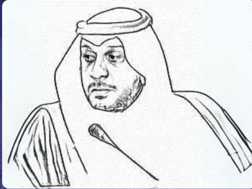
الرئيس المؤسس/ د. فهد العربي الحارثي