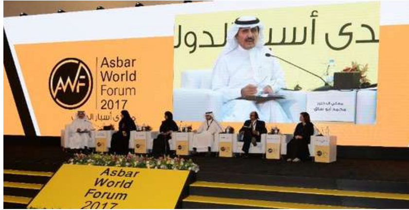
وزير الدولة معالي الأستاذ محمد بن فيصل بن جابر أبو ساق أثناء حديثه في فعاليات منتدى أسبار الدولي