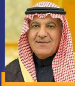
معالي أ. تركي الشبانه وزير الإعلام

يسعدني في هذه الليلة أن أشارككم افتتاح منتدى أسبار الدولي، مباركا للمنتدى انعقاد هذه الدورة للسنة الرابعة على التوالي الذي يعد فرصة مهمة لمناقشة العديد من قضايا التنمية من خلال معطيات الحاضر للمضي بقوة وثبات نحو المستقبل