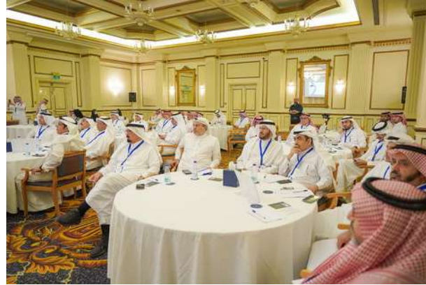
جانب من الحضور في الحفل السنوي للملتقى أسبار