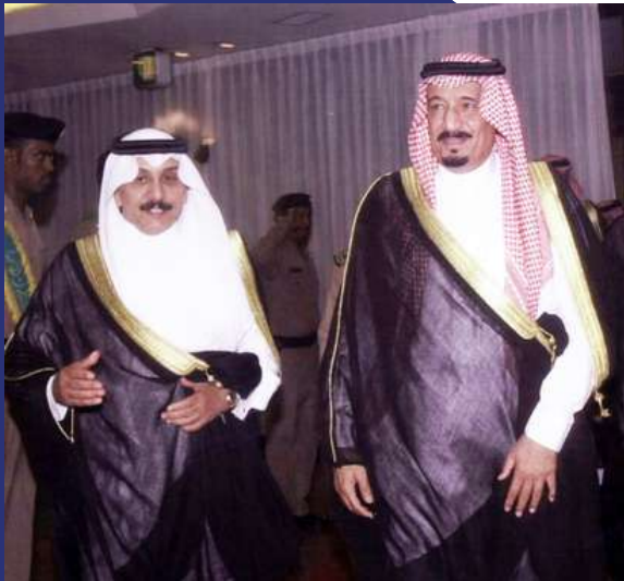
الملك سلمان - حفظه الله