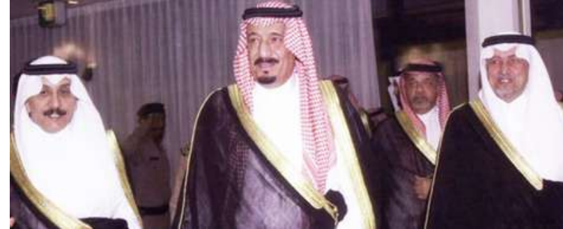
خادم الحرمين الشريفين الملك سلمان بن عبدالعزيز آل سعود في تدشين العام الثاني لصدر صحيفة الوطن وصاحب السمو الملكي الأمير خالد فيصل أمير منطقة مكة المكرمة