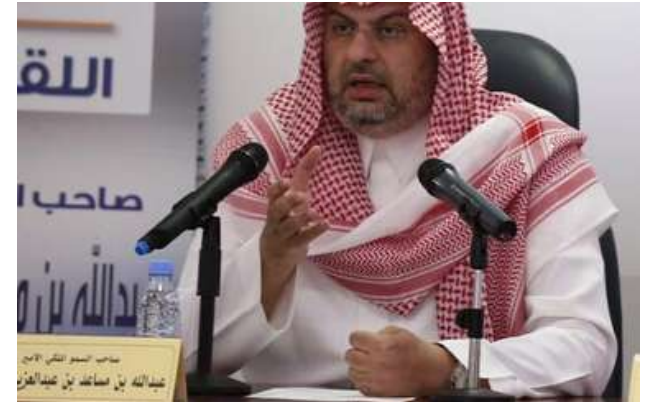
صاحب السمو الملكي الأمير عبدالله بن مساعد بن عبدالعزيز متحدثاً في فعالية ضيف ملتقى أسبار