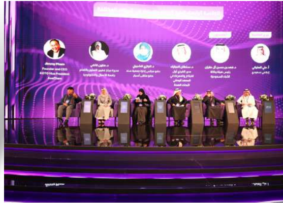
إحدى جلسات المنتدى