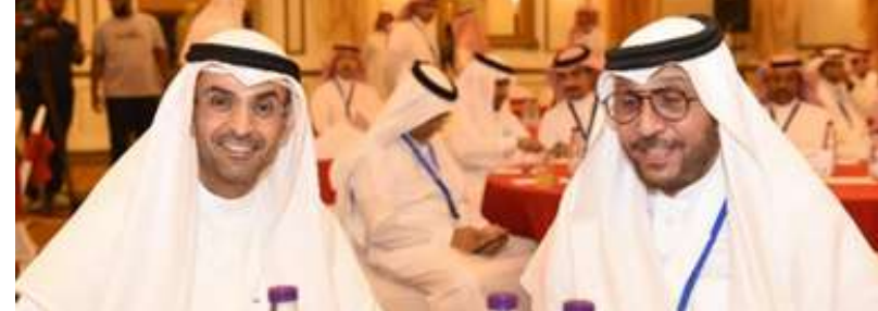
الأمين العام لدول مجلس التعاون الخليج العربية معالي الدكتور نايف فلاح مبارك الحجرف متحدثاً في إحدى لقاءات أسبار