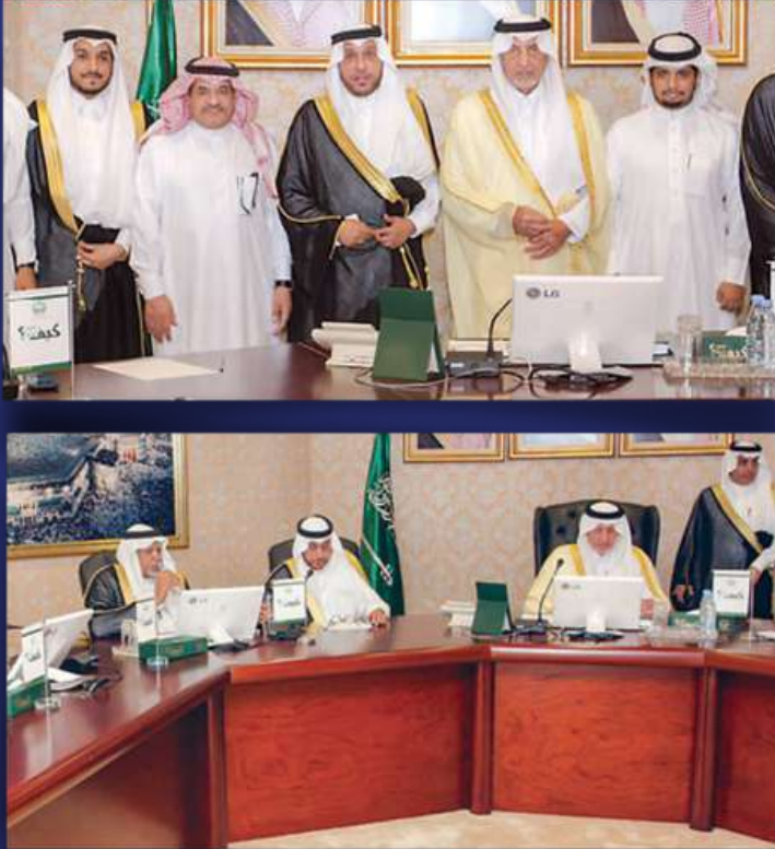
الأمير خالد الفيصل مع فريق العمل على الاستراتيجية