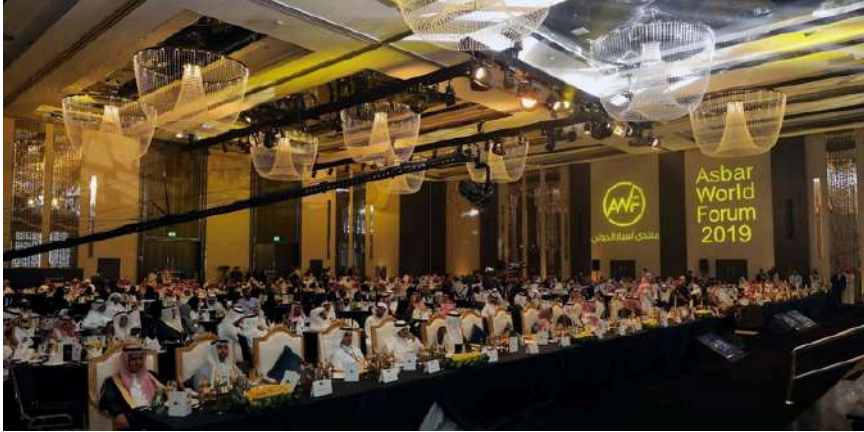
جانب من الحضور في فعاليات منتدى أسبار الدولي