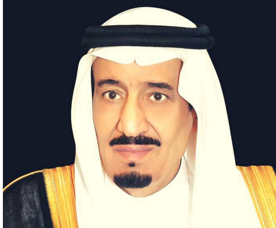
خادم الحرمين الشريفين الملك سلمان بن عبدالعزيز آل سعود

“الاهتمام بالعلم والابتكار، والتطور التقني، وتطوير الكفاءات البشرية، يمثل ركيزة مهمة للتنمية”