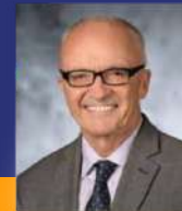
Prof. Finn E. Kydland, Economic Policy and Sustainable Growth

I want to thank the organizers of the Asbar World Forum, and the participants and panellists here for what I think have been very successful discussions.