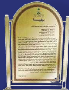
توجيه المقام السامي للعدد من الوزارات

تتبع أهمية إجراء هذه الدراسة الميدانية بأن شريحة الشباب (15 - 29 سنة) بمختلف فئاتهم: الطلاب في المدارس أو الجامعات، حديثو التخرج، الموظفون والموظفات من خريجي مؤسسات التعليم العالي الذين لا تزيد عدد سنوات توظيفهم عن ست سنوات، إضافة إلى المتوقفين والمتسربين من التعليم الثانوي والجامعي، والخريجين الذين ما زالوا يبحثون عن عمل. وقد أجريت الدراسة على مستوى المملكة العربية السعودية، وشملت خمس عشرة مدينة من المدن الرئيسية التي تتوزع في المناطق الجغرافية الرئيسية الخمس (الوسطى، الشرقية، الغربية، الشمالية، الجنوبية).