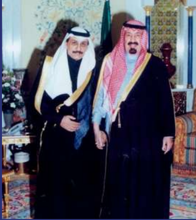
الملك عبدالله - رحمه الله