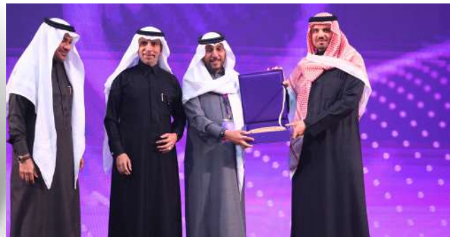
جانب من تسليم الجوائز للفائزين