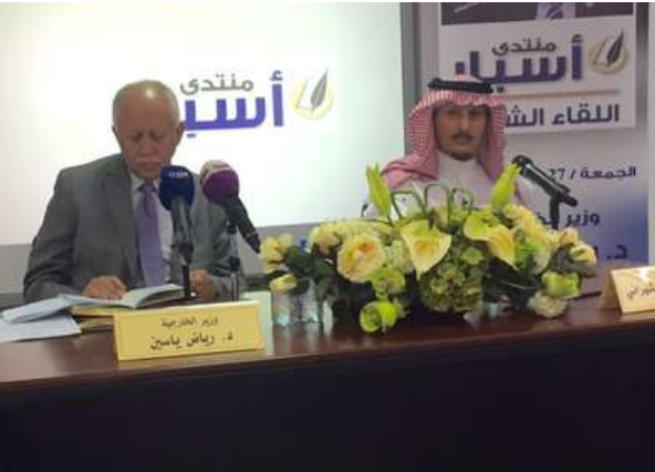
معالي وزير الخارجية اليمني متحدثاً في فعالية ضيف ملتقى أسبار